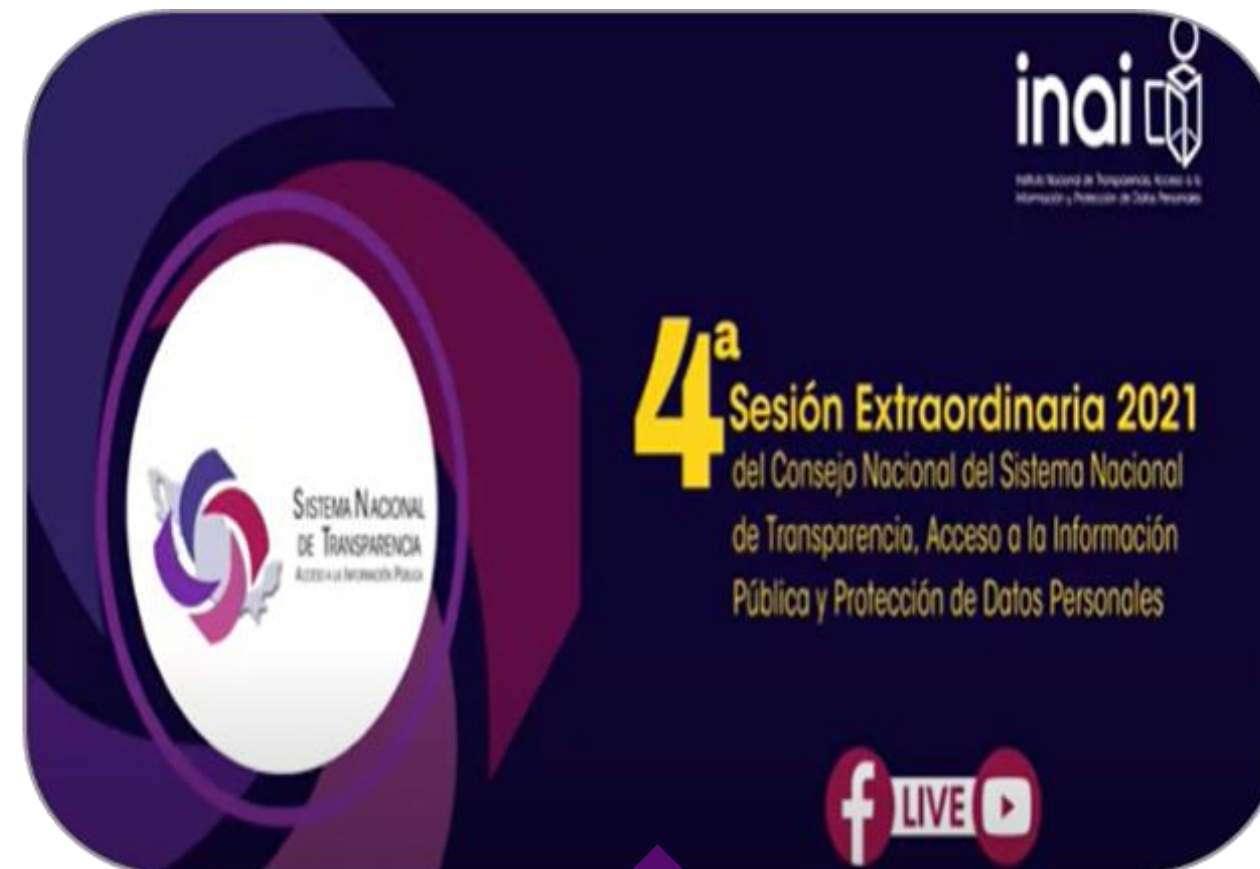
SESIÓN DE CONSEJO NACIONAL DEL SNT 15 OCTUBRE

ENTREGA FORMAL DE LAS PRIMERAS PROPUESTAS AL INAI