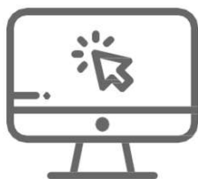
Consulta Ciudadana en línea