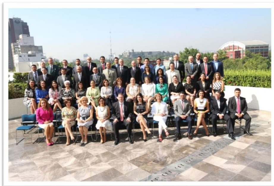
Segunda Sesión Extraordinaria del Consejo Nacional. 13 de abril de 2016