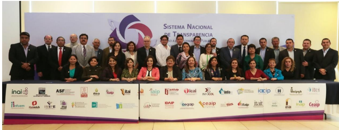
Jornada de Renovación o ratificación de las Instancias del SNT. 7 y 8 de noviembre de 2016

Desde su instalación en noviembre de 2015, las Comisiones Ordinarias del SNT, han sesionado un total de 58 ocasiones, 31 de estas sesiones fueron de carácter ordinario y 27 de carácter extraordinario. Referente a las sesiones de las Regiones, estas instancias han sesionado en 21 ocasiones, 10 de carácter ordinaria y 11 de carácter extraordinaria.