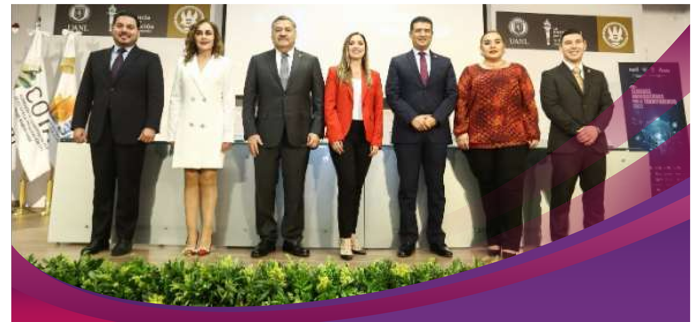
Auditorio Jorge Carpizo MacGregor de la Facultad de Ciencias Políticas y Relaciones Internacionales de la Universidad Autónoma de Nuevo León.

Estas jornadas fueron impulsadas por el INAI y el INFOCDMX con al apoyo de los órganos garantes que integran el Sistema Nacional de Transparencia y diversas Universidades del país, en donde se desarrollaron conferencias magistrales, conversatorios, talleres, y mesas de debate universitario en las que participaron la comunidad académica y estudiantil de tres estados de la Región Norte: Nuevo León, Chihuahua y Tamaulipas, los días 19, 20 y 22 de septiembre