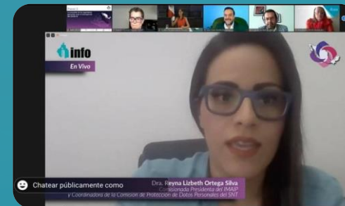
Ciudad de México