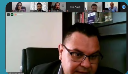
Baja California Sur