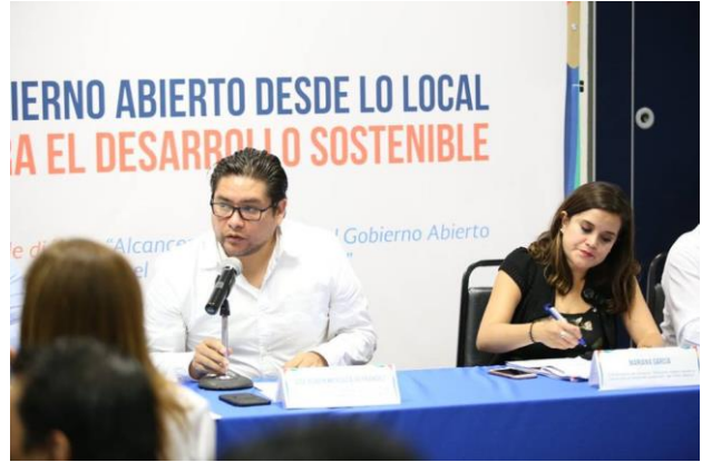
Gobierno Abierto desde lo local para el desarrollo sostenible