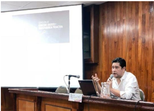
Diplomado Retos de los Nuevos Gobiernos