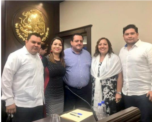
Firma de Declaración Conjunta para la Implementación de Acciones para un Gobierno Abierto