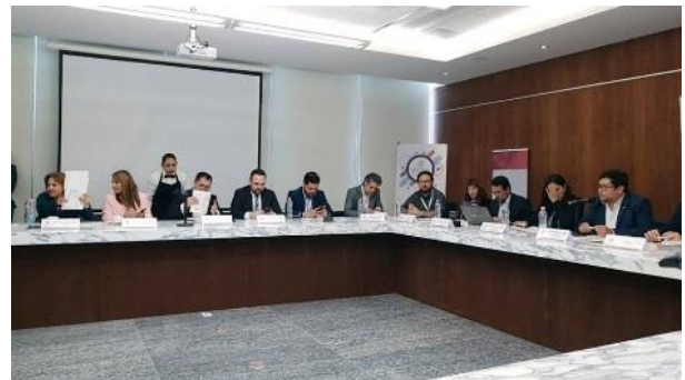
Reunión de Trabajo de la Comisión de Gobierno Abierto