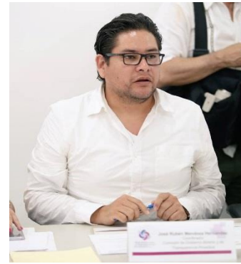
Primera sesión ordinaria de la Comisión de Gobierno Abierto