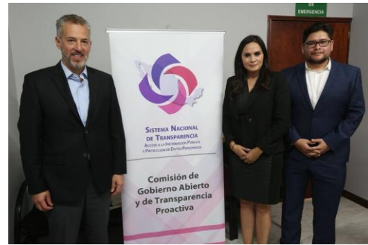
Primera sesión extraordinaria de la Comisión de Gobierno Abierto