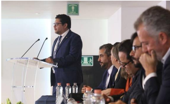
I Cumbre de Gobierno Abierto