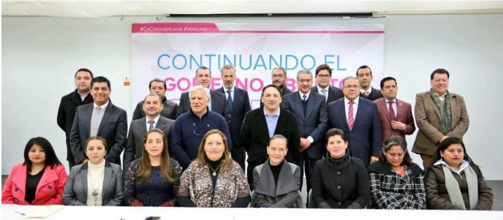
Secretariado Técnico de Gobierno Abierto en Veracruz II Plan de Acción Local