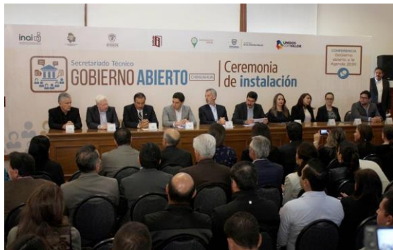
Instalación del Secretariado Local de Gobierno Abierto del Estado de Chihuahua