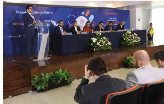
I Cumbre de Gobierno Abierto