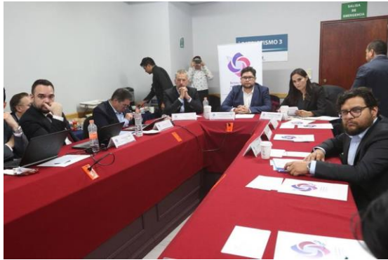
Primera sesión extraordinaria de la Comisión de Gobierno Abierto