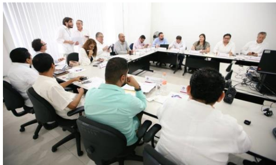
Primera sesión ordinaria de la Comisión de Gobierno Abierto