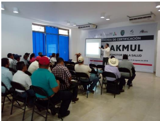
Segundo Encuentro de Gobierno Abierto, Transformando la Relación entre Gobierno y Sociedad