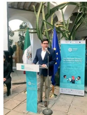
Secretariado Técnico de Gobierno Abierto en Oaxaca